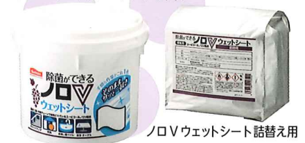
ノロVウェットシート 詰替え用